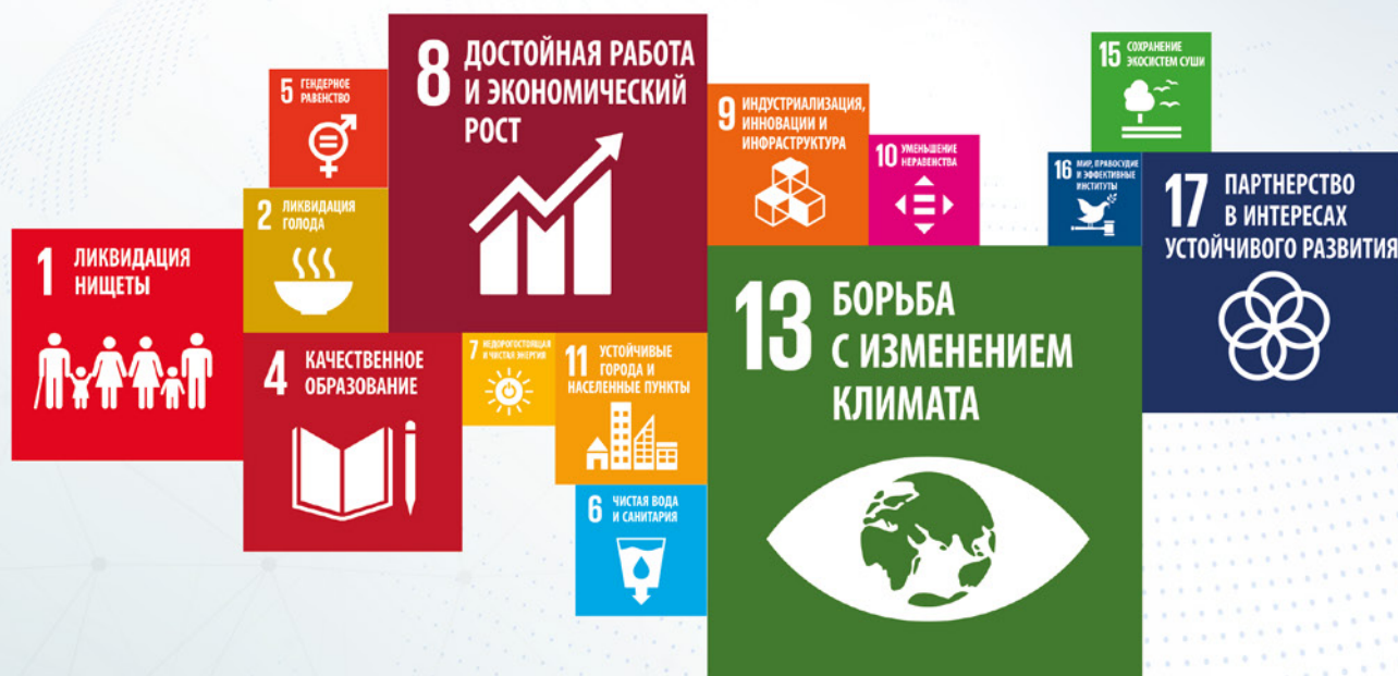
Диаграмма отражает тематические области пропорционально их представленности в портфеле проектов.